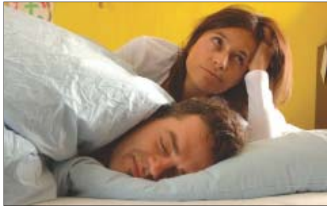
Gesundheitsgefährdend: Anhaltende Schlafstörungen können Depressionen zur Folge haben.