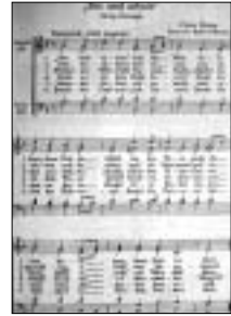
Das Bundeslied „bet und arbeit“ von Erich Weiner (Text) und Hanns Eisler (Musik):

Nähere Informationen zur Arbeitersängerbewegung gibt es in der Lindener Geschichtswerkstatt im Freizeithaus Linden (Geschichtskabinett). Öffnungszeiten: montags 10 bis 12 Uhr oder nach telefonischer Absprache unter 2 10 71 25 oder 1 68 - 4 01 84.