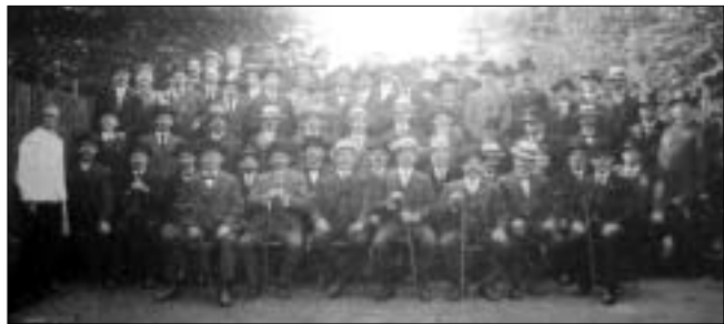
Gesangsvereine wie die Lindener „Symphonia“ versuchten unmittelbar nach dem Krieg an die Traditionen der Arbeitersängerbewegung anzuknüpfen. Bereits im November 1945 erklangen aus dem Lokal Hohmann an der Weberstraße wieder die alten Arbeiterlieder.