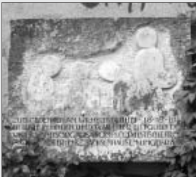
Gedenkplatte für den sozialdemokratischen Widerstandskämpfer Wilhelm Bluhm am Gebäude von FAUST e.V., Zur Bettfedernfabrik 3.